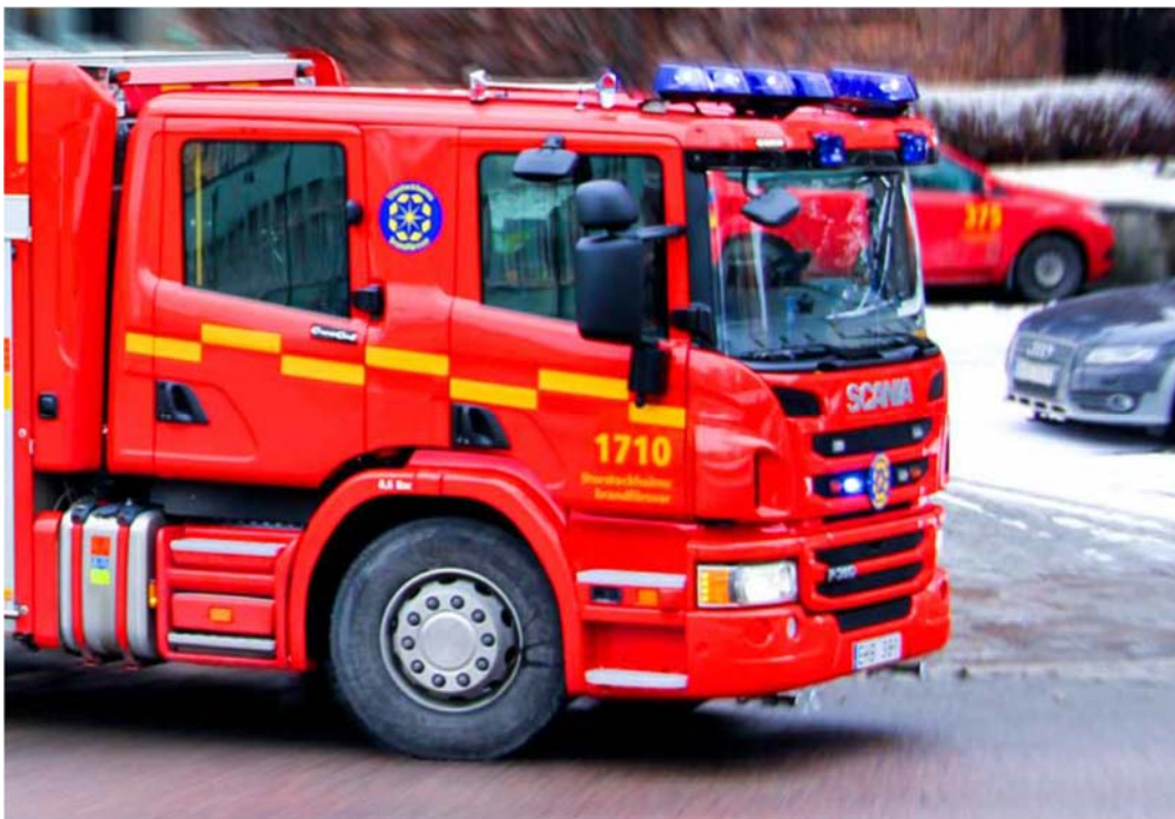
Figur 1. Storstockholms brandförsvär, bild från årsredovisning 2013.

Vid en anläggning, där verksamheten innebär fara för att en olycka ska orsaka allvarliga skador på människor eller miljön, är anläggningens ägare eller den som utövar verksamheten på anläggningen skyldig att i skälig omfattning hålla eller bekosta beredskap med personal och egendom och i övrigt vidta nödvändiga åtgärder för att hindra eller begränsa sådana skador. Den som utövar verksamheten är skyldig att analysera riskerna för sådana olyckor som kan orsaka allvarliga skador. Länsstyrelsen är den myndighet som beslutar vilka verksamheter som omfattas av skyldigheterna. För flygplatser som har meddelats drifttillstånd enligt 6 kap. 8 § första stycket luftfartslagen (2010:500) och verksamheter som omfattas av lagen (1999:381) om åtgärder för att förebygga och begränsa följderna av allvarliga kemikalieolyckor gäller dock skyldigheterna utan att Länsstyrelsen behöver fatta beslut.